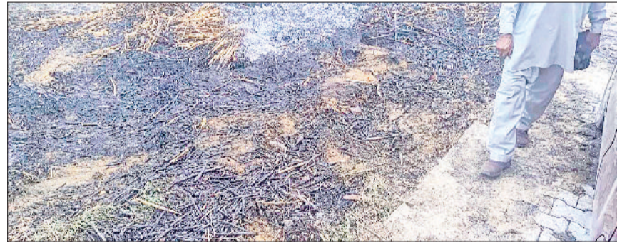
मंडी अटेली। किसान के खेत में कड़बी में आग के बाद बनी राख।