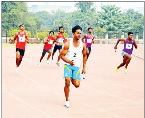
भिवानी। दौड़ स्पर्धा में भाग लेते प्रतिभागी।