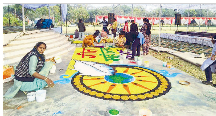
नारनौल। गीता महोत्सव की तैयारी में जुटे कर्मचारी।