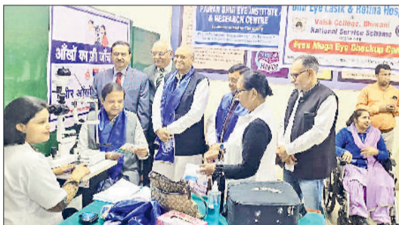
भिवानी। आयोजित शिविर में आंखों की जांच करते हुए।

वैश्य महाविद्यालय की राष्ट्रीय सेवा योजना इकाइयों एवं धीर आई हॉस्पिटल के संयुक्त तत्वावधान में लगा शिविर