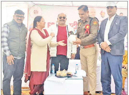
भिवानी। कार्यक्रम में मुख्य अतिथि पुलिस अधीक्षक का स्वागत करते हुए।