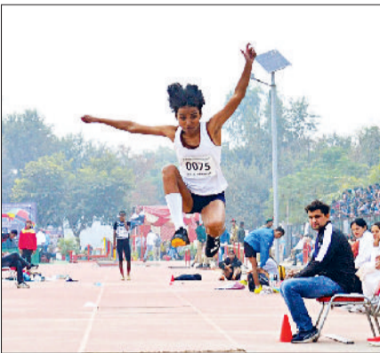
भिवानी। प्रतियोगिता में लंबी छलांग लगाते हुए।